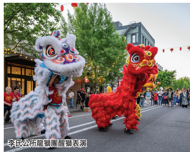
李氏公所龍獅團醒獅表演。