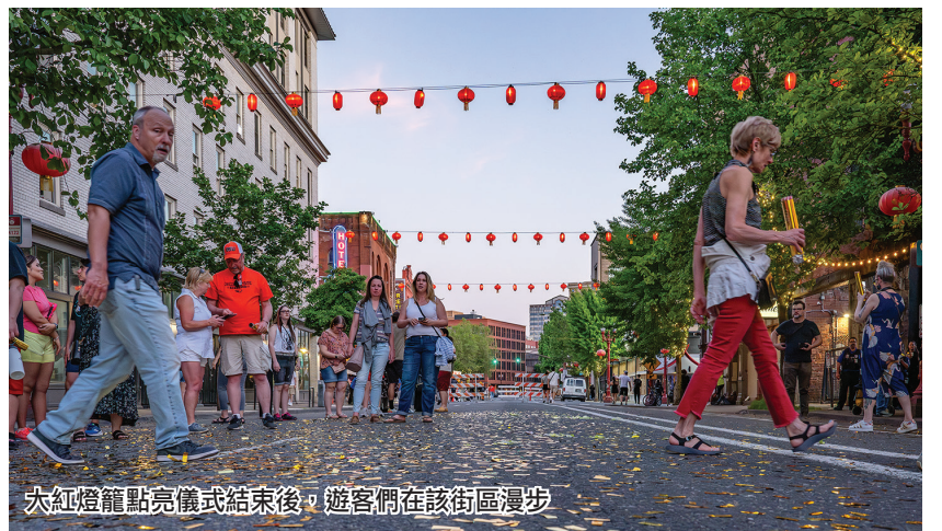
大紅燈籠點亮儀式結束後，遊客們在該街區漫步。